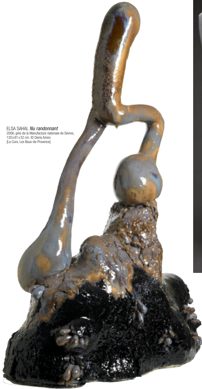
ELSA SAHAL Nu randonnant 2006, grès de la Manufacture nationale de Sévres, 120 x 81 x 32 cm. [La Cure, Les Baux-de-Provence]