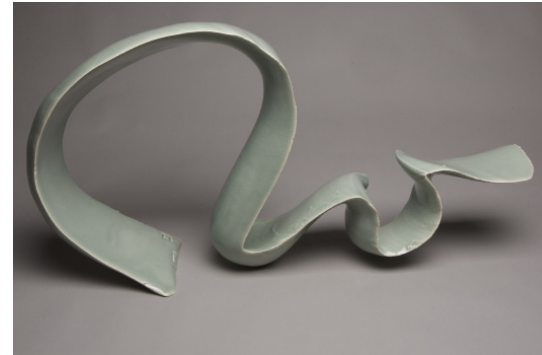
JEAN-FRANÇOIS FOUILHOUX Tag 2012, grès sculpté, 42 x 79 x 14 cm. © Jean-François Fouilhoux. [Post Tenebras Lux, Les Baux-de-Provence]