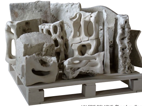
VALERIE DELARUE Chambre d'argile 2010, grès de Sévres, 120 x 40 x 67 cm. © Valérie Delarue. [Hôtel de Marville, Les Baux-de-Provence]