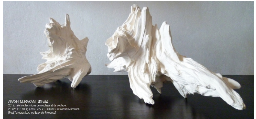
AKASHI MURAKAMI Waves 2012, faïence, technique de moulage et de coulage, 23 x 26 x 18 cm (g.) et 50 x 27 x 19 cm (dr.). © Akashi Murakami. [Post Tenebras Lux, Les Baux-de-Provence]