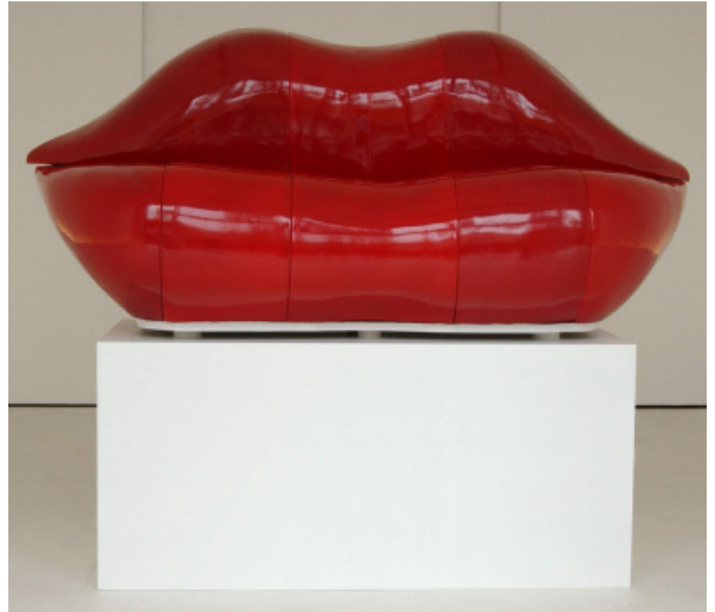
BERTRAND LAVIER La Bocca 2006, porcelaine, 80x170x80 cm. Coll. Cité de la céramique, Sévres, © Adagp. [Hôtel de Marville, Les Baux-de-Provence].