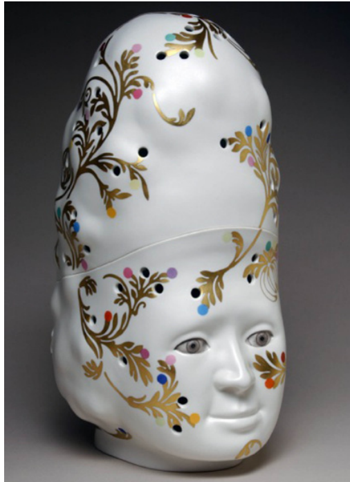
FRANÇOISE VERGIER Le Triomphe de Flore 2005, porcelaine de Sévres, haut. 130 cm. © Sévres, Cité de la céramique / Gérard Jonca, © Adagp. [La Cure, Les Baux-de-Provence]